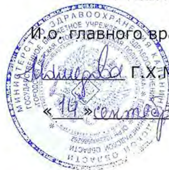
График работы стоматологического кабинета МАОУ СОШ № 43 на 2020-2021 учебный год.